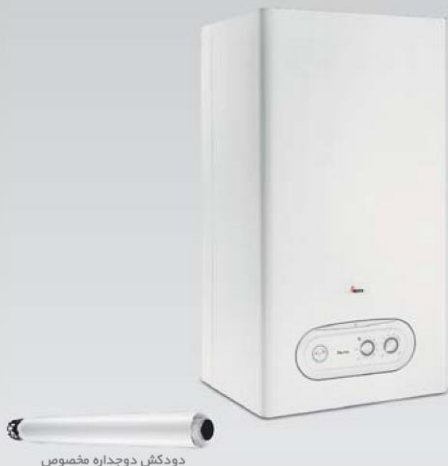
دودکش دوجداره مخصوص